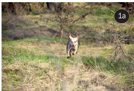
Zdjęcie zostało wykonane z dużej odległości obiektywem o ogniskowej 200 mm, czyli dość długim, jednak zbyt krótkim, by pies zajmował wystarczająco dużą część kadru; a – zdjęcie wykadrowane w aparacie, b – przewidziewo przycięte w programie do obróbki zdjęć.

N iestety często na zdjęciach widzę psy mikroskopijnych rozmiarów, niczym łebki szpilek. I to szpilek wciśniętych w sam środek kadru (fot. 1a). Zdjęć takich nie uratuje ani dobra ostrość, ani poprawne naświetlenie, jeśli to pies miał być jego głównym bohaterem.