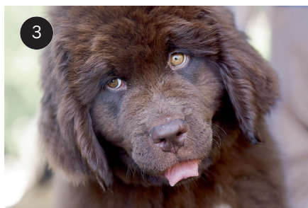
Zdjęcie wykonane z niewielkiej odległości obiektywem portretowym o ogniskowej 105 mm. Tak duże zbliżenie zwykle oddziałuje na emocje silniej niż zdjęcia w szerokim planie.