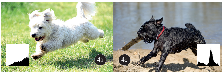
Zdjęcie psa o białej sierści łatwiej prześwietlić podczas słonecznej pogody (4a) niż zdjęcie psa czarnego (4b).

od kompletnej czerni – lewa część wykresu, poprzez przeciętną jasność – część środkowa, do kompletnej bieli – część prawa. Wykresy takie dołączyliśmy do analizowanych tutaj zdjęć. W dobie fotografii cyfrowej niemal każdy aparat ma podgląd histogramów. Można się im przyjrzeć na już wykonanych zdjęciach, a w wypadku niektórych aparatów również przed wciśnięciem spustu migawki.